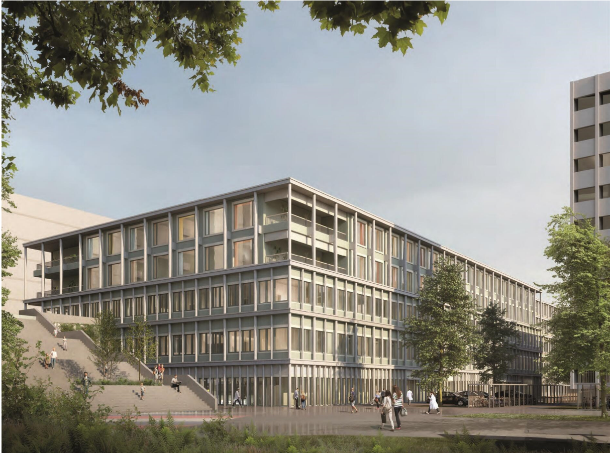
Bildquelle: Luzerner kantonsspital